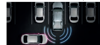
RCTA (Rear Cross Traffic Alert) ระบบช่วยเตือนขณะถอยรถ

SAFETY TECHNOLOGY (สำหรับรุ่นขับเคลื่อน 4 ล้อ)