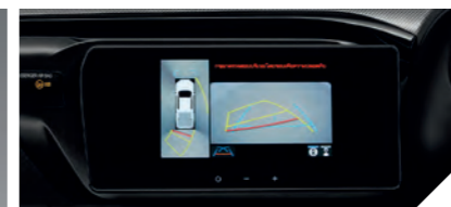
PVM (Panoramic View Monitor) กล้องมองรอบคัน 360 องศา