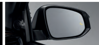
BSM (Blind Spot Monitor) ระบบช่วยเตือนมุมอับสายตา