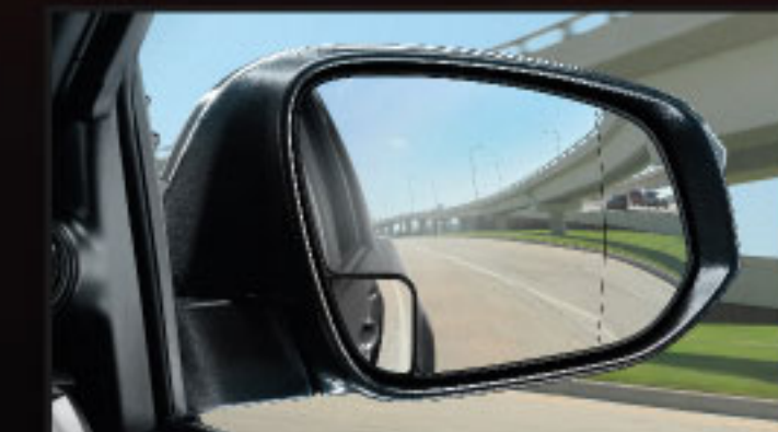
กระจกข้างช่วยองมุมอับสายตา