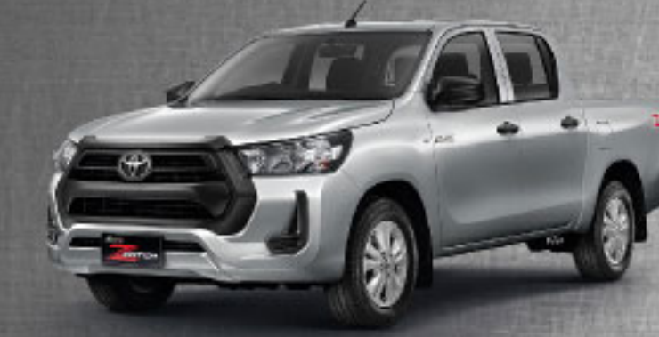
2.4 MID STD AT/MT