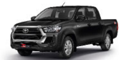
ATTITUDE BLACK MICA