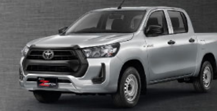
2.4 ENTRY STD MT