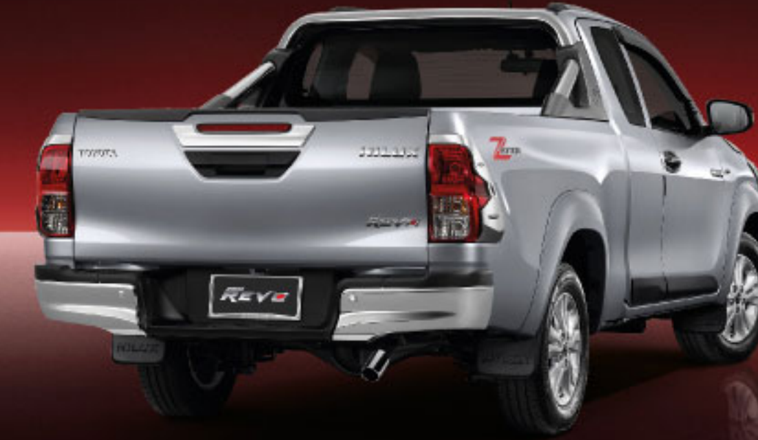
ดูสมารถ เห็น จับเลื่อน 2 สี 2.4 Mid AT