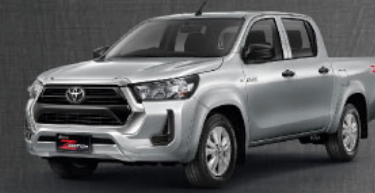
2.4 MID AT/MT