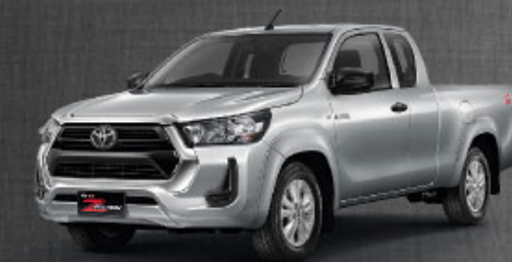
2.4 MID AT/MT