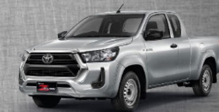
2.4 ENTRY MT