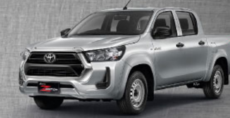
2.4 ENTRY MT