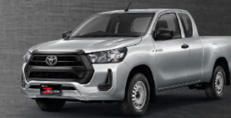
2.4 ENTRY STD MT