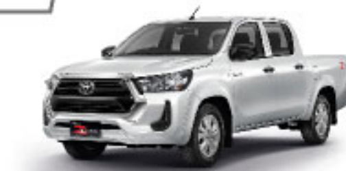
SUPER WHITE II