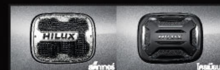
ชุดตกแต่งฝาด้านหน้า

อุปกรณ์ตกแต่งแท้โดยได้รับประกันสูงสุด 5 ปี หรือ 150,000 กม.