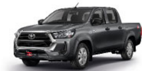
DARK GREY METALLIC