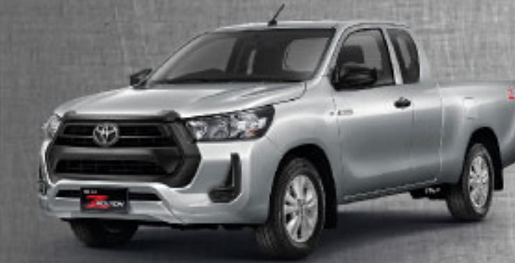
2.4 MID STD AT/MT